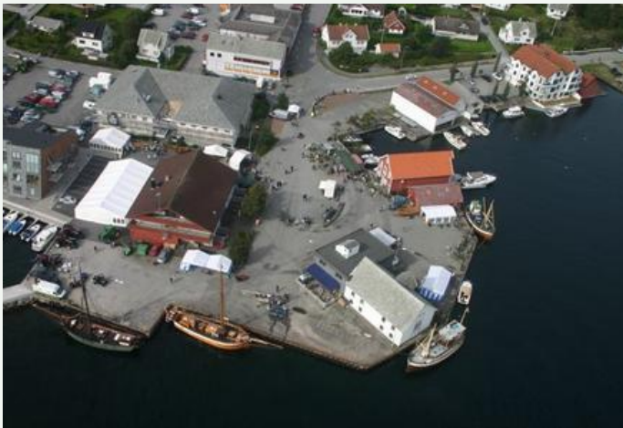
Vikevåg sentrum kaiområde