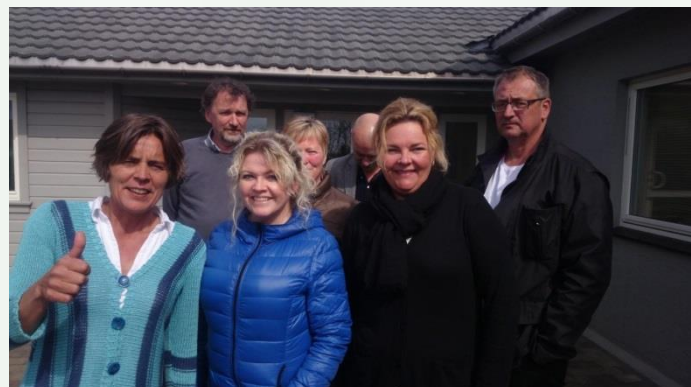
Sertifiseringen i forretningskonseptet VekstSporet har startet, her v/ næringshagene i Rogaland.

Flere har etterlyst på hvilken måte næringshagen kan hjelpe eksisterende bedrifter i å vokse, at det er viktig også å ha fokus på det eksisterende næringsliv og ikke bare konsentrere seg om nye gründerbedrifter. Disse uttalelser deler vi fullt ut og med deltakelse i SIVA sitt næringshageprogram er nettopp eksisterende næringsliv i både Finnøy og Rennesøy målgruppen. Vi har derimot savnet god metodikk og et verktøy til bruk ovenfor vårt eksisterende næringsliv, noe som vi nå skal få på plass hos oss. Vi har testet metodikken «Vekstdrive» ut på enkelte bedrifter i Finnøy og Rennesøy, med såpass gode resultat at vi nå har søkt SIVA og fått tilskudd til å lage metodikken på norsk og utvikle vår modell av dette konseptet, som er hentet fra Danmark. Vi vil kalle konseptet VekstSporet og har nå startet en sertifisering av ansatte og konsulenter tilsluttet næringshagene i Rogaland (4). 20.-21. april startet sertifiseringen med en samling på Finnøy. På www.synligogstolt.no kan du lese en kort beskrivelse av hva metodikken går ut på. Vi vil fra ca. september/ oktober 2015 starte arbeidet med å markedsføre og synliggjøre metodikken. Målet er å styrke eksisterende næringsliv i kommunene våre.