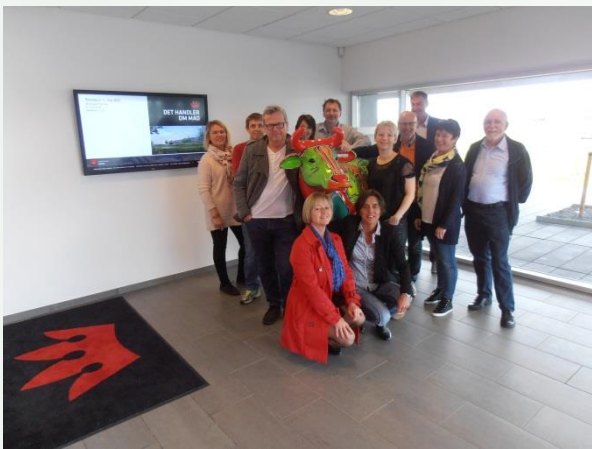
Gjengen fra Finnøy besøker Danish Crown, nord-europas største storfeslakteri.