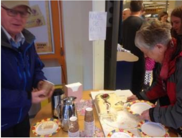
Handle lokalt dagen i Vikevåg ble godt mottatt av innbyggere i Rennesøy, her fra Coop Prix i Vikevåg»